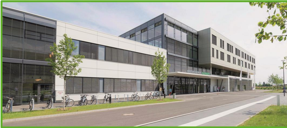
Hochtanus-Kliniken gGmbH Bad Homburg