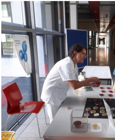
Lernstation: 3 Abklatschproben „den Bakterien auf der Spur“