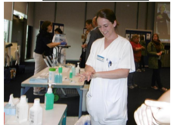
... zur effektiven Händedesinfektion, auch in stressigen Situationen ...