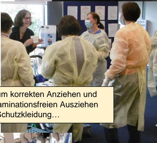
... zum korrekten Anziehen und kontaminationsfreien Ausziehen der Schutzkleidung...