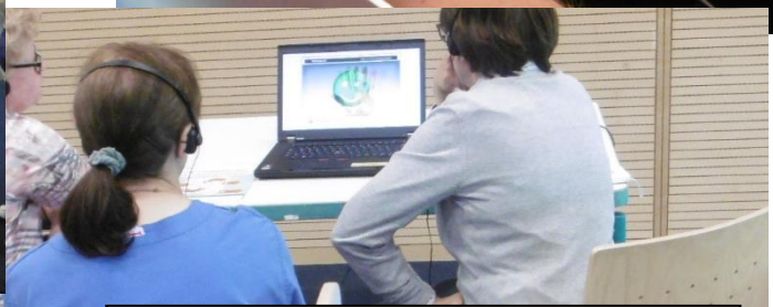
... und natürlich zum WHO-Modell: die Händedesinfektion sicher platziert in komplexen Arbeitsabläufen.