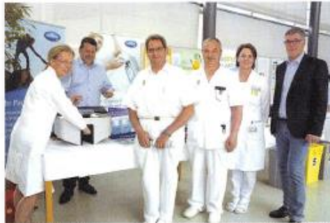
Highlight beim Hygiene-Aktionstag war der Semmelweis-Scanner, der zeigte, wie gründlich die Händedesinfektion erfolgte.