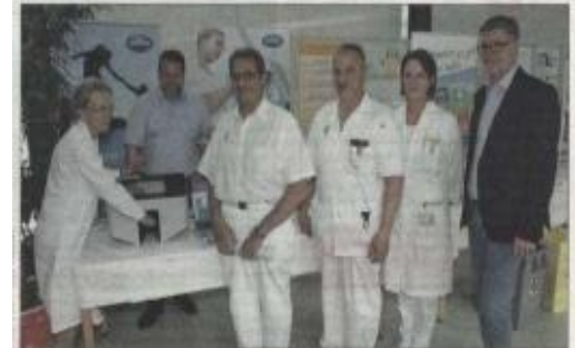
Verantwortliche des LKH Hartberg testen den Semmelweis-Scanner.

Das LKH Hartberg beteiligte sich seit 10 Jahren an der Aktion „Saubere Hände“ und wurde für die erreichten Verbesserungen auch mit Zertifikaten in Gold und Silber von der Charité Berlin ausgezeichnet.