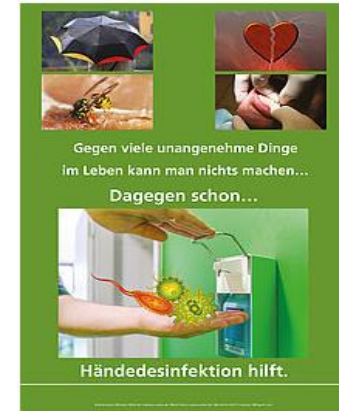
3. Platz: Poster 1