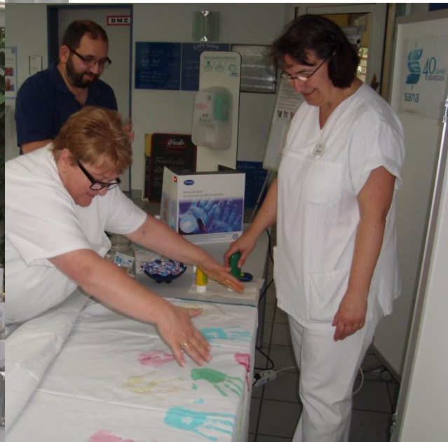
Sana Klinik Nürnberg, 16.06.2016