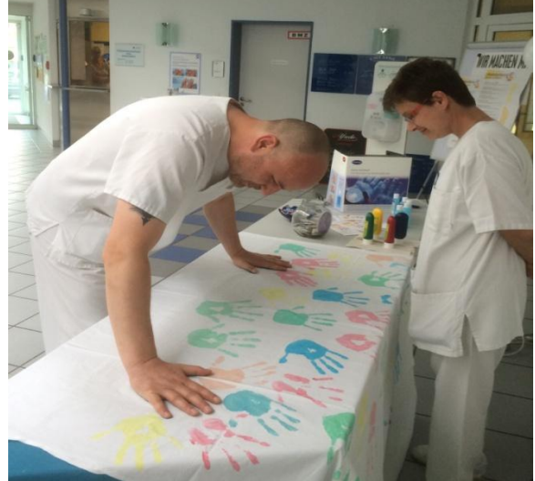
Sana Klinik Nürnberg, 16.06.2016